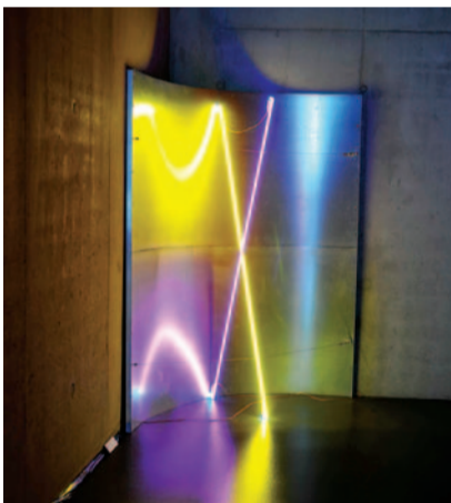
Pavel Korbička, Interference , 2010, z cyklu Jiné interpretace , světelná instalace, ocel, plech, neon, 300 x 200 cm