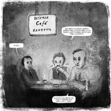
Petr Korunka, Dvojštěrbinový experiment , 2012, z cyklu Idea univerzity , komiks, kresba, počítačová grafika, tisk, 100 x 70 cm, text Filip Grygar

Současný německý filozof Odo Marquard (1928) tvrdí, že sféry dominance filozofie ubývaly s nárůstem vzdělanosti. S příchodem křesťanství si úvahy o Bohu, spásě a štěstí pro sebe vyhradila křesťan-