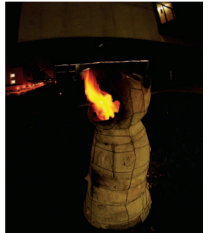
Alexandra Prokopová, Schödingerova kočka , 2012, z cyklu Jiné interpretace , objekt v. 170 cm, ø 70 cm, SiO 2 , Al 2 O 3 , Fe 2 O 3 , TiO 2 , video, 00:01:30, text