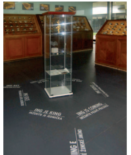
Veronika Doučliková, Ing je King , 2012, z cyklu Algoritmus Evolution , instalace, text, mixed media, 200 x 40 x 40 cm