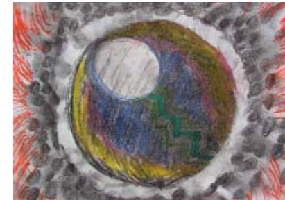
Chen Jin-rong, Spermie oplodňuje vajíčko, 2004, pastel, papír, 25 x 30 cm