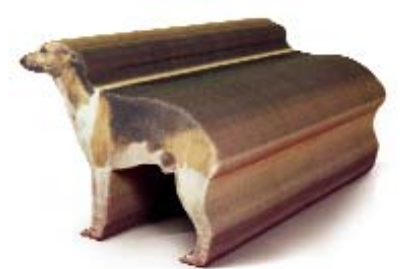
Radi Designers (Francie), Lavička ohař, 1998, polyuretanová pěna, 60 x 140 x 73 cm.