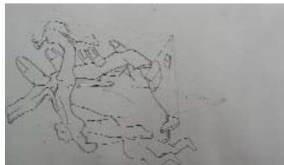
František Bártík, Rovnice o mnoha neznámých, 2004, tužka, papír, 25 x 30 cm