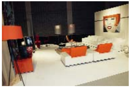
Pohled do expozice Spaces '04 ve Veletržním paláci v Praze, velkoplošný byt.