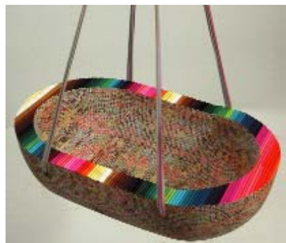
Ieva Araja (Lotyšsko), Kolébka pro génia, pastelky, z výstavy Mléčná dráha středoevropského designu.