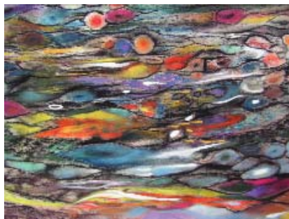
Hsiu Hui-ling, Valící se emoce, 2004, pastel, papír, 35 x 50 cm.