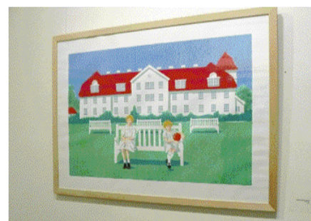
Myrtia Wefelmeier, Bez názvu, 2005, sitotisk, papír, 105 x 145 cm.