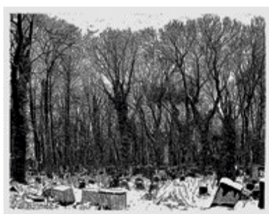
Philipp Hennevogl, Hřbitov, 2007, linoryt, papír, 111 x 144,4 cm.