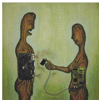
Wolfgang Trettnak, Navázání spojení, 2005, akryl, elektronické komponenty, plátno, 80 x 80 cm.

kariéru vědce a s velkou mírou hazardu se vydal za hlasem srdce k umění. Svoji výtvarnou tvorbu nemohl začít nikde jinde a o ničem jiném než o propojenosti člověka s technikou. Ví, jaké je soužití s mikroprocesory ve vědecké laboratoři, kde nervové impulzy vybuze v mozku neaktivují svaly vědce, ale mrtvé tělo přístroje k vykonání inteligentního zadání. Roky strávené v laboratoři nemizí a transformace exaktního vědce v umělce s emočním vnímáním světa, je přerodem kukly v motýla. Výsledkem tohoto procesu metamorfózy je tvorba jako umělcova zpověď. Trettnakovy obrazy jsou plné metafor. Do kočky hadičky dodávají živiny podobně jako do nás média pumpují informace a zbavují nás vlastního úsudku. Už nepotřebujeme komunikovat přímo, slova a myšlenky se