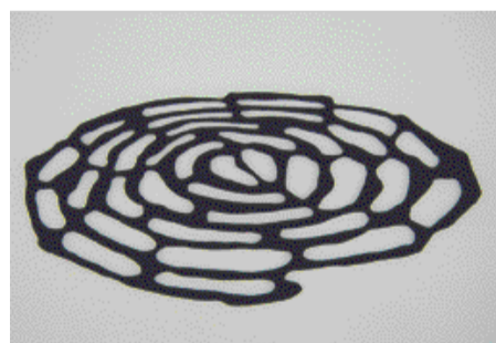
Bodo Korsig (spolupráce Paul Auster), Vymaz svoji minulost, 2005, z cyklu Pulz, umělá hmota, litina, 100 x 250 cm.