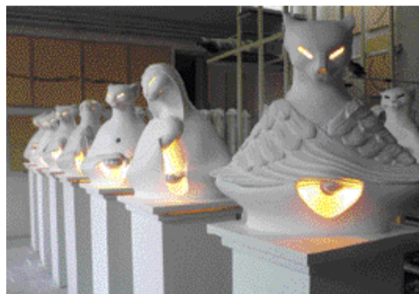
Libor Krejcar, zřepdu Pantheria - Anděl, 2005, Pantheria - Madony 1-6, 2006, sádra, elektrina, v. 67 cm.